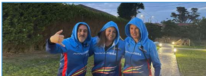
Disfrutando de una de las etapas de El Camino de Santiago.