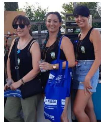
Asistentes con su merchandising en Rincón de Seca.

Las Torres de Cotillas, entre otros. Al mismo tiempo, nuestra tienda de Paterna, se "vistió" con las protecciones requeridas para la famosa "Cordà" de Pater-