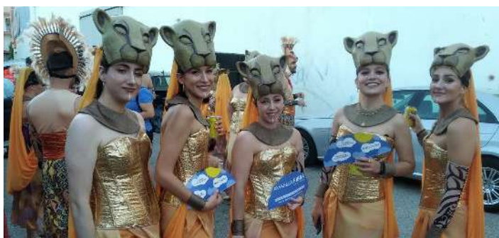
Desfile en las Torres de Cotillas.

este mes de Agosto, mes por excelencia de las Fiestas Locales, estuvimos presentes repartiendo nuestro merchandising en las Carrozas de Rincón de Seca y en el desfile de