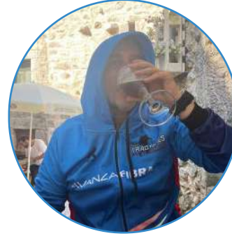
También hay tiempo para refrescarse...