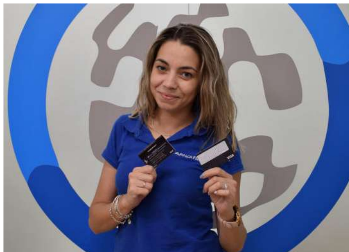
Fotografía de la campaña del bono libro.

pone la "vuelta al cole", y ayudar a estos gastos extra que se generan en septiembre, a vuelta de las vacaciones. Esta acción continúa con el apoyo que realiza la empresa a la Educación y la Enseñanza. Recuerda que se puede participar hasta el 30 de septiembre.