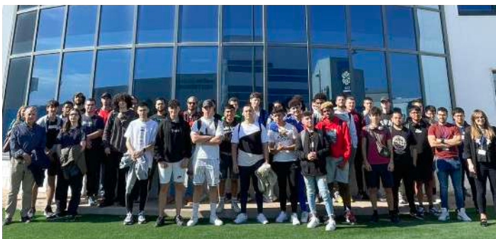
Día de la visita.

una charla de motivación y orientación laboral, y la realización de la práctica de fusión de fibra óptica por parte de los alumnos, paso previo a la entrega de diplomas y entrega de obsequios a los alumnos y a los docentes, a los cuales se les entregó material de instalación para que puedan seguir practicando en su centro educativo. Estas jornadas de "Promoción de Nuevos Talentos" han sido pioneras por parte de una empresa de telecomunicaciones en una fuerte apuesta por la Educación, uno de los valores más importantes para la operadora y se prevé que el año que viene puedan impactar en más de 2000 alumnos.