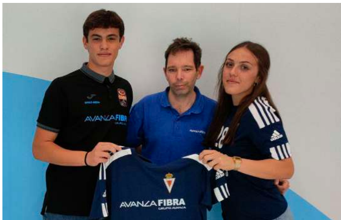
Entrega de la camiseta.

El equipo de balonmano San Lorenzo de Puente Tocinos (Murcia) hizo entrega en la tienda de esta localidad de la camiseta oficial que lucen en sus partidos. Esta camiseta lleva el logo de Avanza Fibra en agradecimiento por la conexión a internet que la operadora instaló de manera gratuita en las instalaciones del Pabellón Municipal para que se puedan retransmitir los partidos en directo a través de streaming.