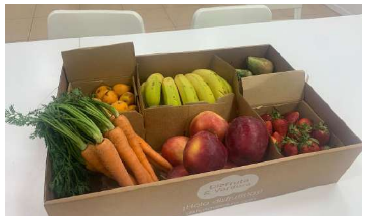
Fruta en el comedor de la central de Avanza Fibra.

Con el fin de promover los hábitos de vida saludable, Avanza Fibra ha comenzado a suministrar fruta fresca disponible en el comedor de su oficina central. Todos los martes y jueves se irán renovando estas piezas de fruta variada y hortalizas. La empresa encargada de hacer el reparto semanal es "Disfruta y Verdura".