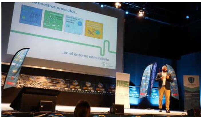
Presentación de Sport4Cancer.

en tratar y analizar cuestiones como el ejercicio de fuerza en el cáncer, cómo mantenerse activo después del cáncer, deporte en mujeres con cáncer de mama, entre otras. Durante los días 20 y 21 de abril se dieron cita en este congreso grandes profesionales internacionales de la medicina y el deporte, que presencialmente y a través de streaming en directo, enseñaron mucho sobre estos aspectos a todo el público asistente.