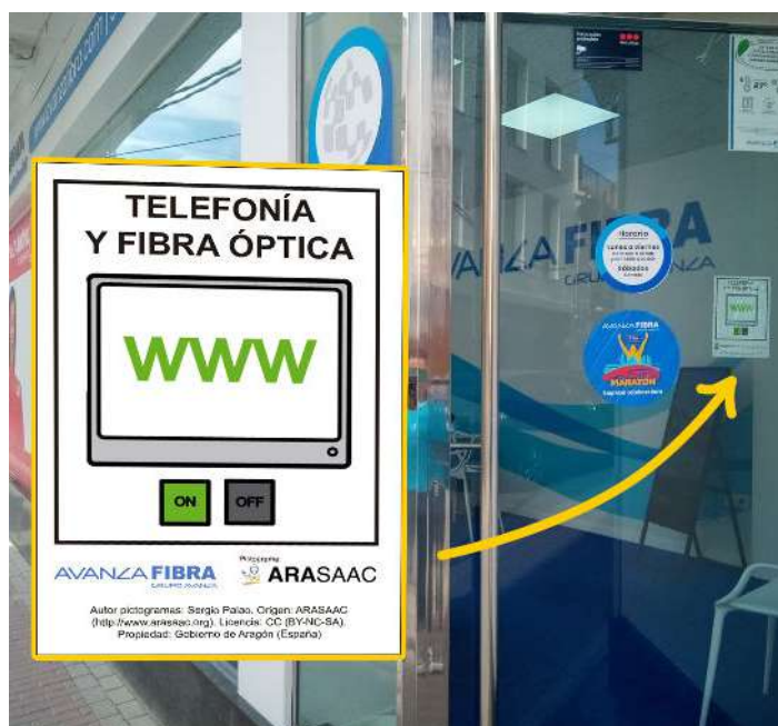
Ejemplo del pictograma que se colocará en las tiendas.

Gracias a esta iniciativa, más de 100 comerciales y casi 60 tiendas de Avanza Fibra – cifra que sigue aumentando durante este año – también se concienciarán sobre este tema y contribuirán a que las personas con TEA puedan tener más facilidad a la hora de comunicarse y de percibir el entorno en el que se mueven.