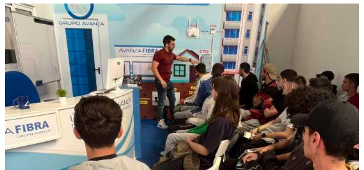
Alumnos recibiendo formación.