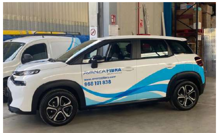
Vehículos vinilados con la identidad de Avanza Fibra.