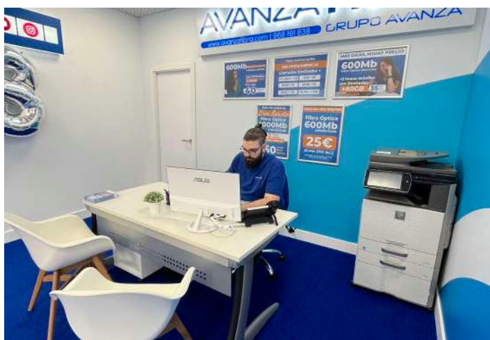
Interior de la tienda.

clientes podrán beneficiarse del internet por días o por meses, donde se paga únicamente por el tiempo que se tiene contratado el internet. Esta nueva apertura forma parte del gran despliegue de la compañía que continúa por Almería (donde en breve abrirá sus puertas una nueva tienda en Vera), Granada, Murcia, Alicante, Valencia, Albacete y Cuenca. Puedes ver el vídeo de apertura aquí.