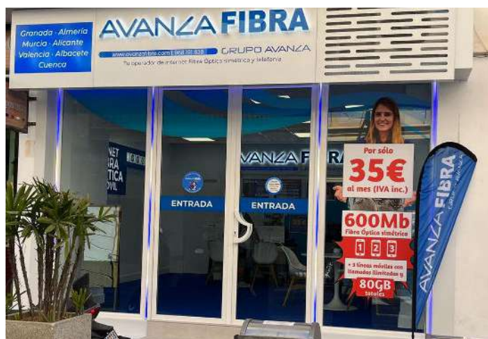
Exterior de la tienda.