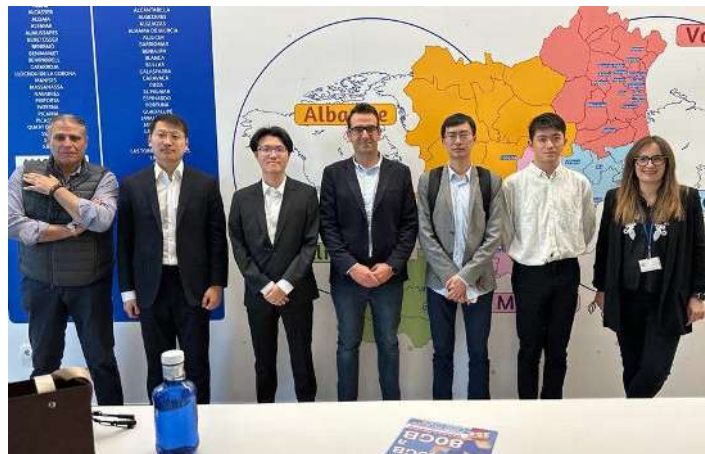
Directivos de Avanza Fibra y FiberHome.

Esta semana los directivos de Avanza Fibra se reunían con Fiberhome, uno de los proveedores más importantes de equipos de telecomunicaciones y redes, especializados en redes IP. La operadora persigue situarse a la vanguardia no solo en cuanto a atención al cliente sino también en el ámbito tecnológico.