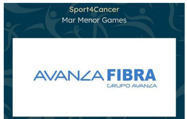
Web del evento.