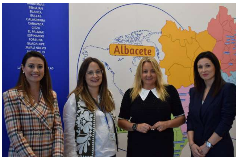
Directivas de Avanza Fibra y Banco Santander tras cerrar el acuerdo.

demuestra su apuesta firme para que los trabajadores sigan mejorando sus condiciones laborales.