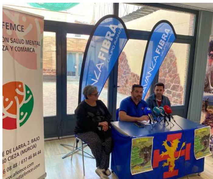
Presentación del evento.

Hace unos días tuvo lugar la presentación y la apertura de las inscripciones para la séptima edición de la carrera Puentes Trail Running Cieza, de la que Avanza Fibra es patrocinadora. Este acto tuvo lugar en el Hogar del Guía OJE-Cieza, donde se explicaron todos los pormenores más importantes referentes a la prueba, como distancias, recorrido, requisitos para la inscripción y premios para los ganadores. El domingo 26 de noviembre se realizarán las tres pruebas, que tendrán carácter solidario.