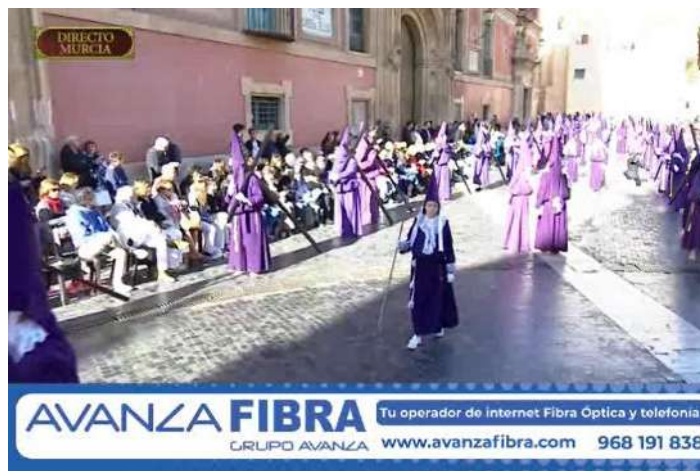
Faldón de Avanza Fibra durante una retransmisión.

Avanza Fibra ha estado presente en los momentos más importantes de las retransmisiones de Semana Santa como proveedor de internet para Periódico El Lorquino, que emitió en streaming las procesiones de Lorca, las cuales a su vez fueron emitidas a través de la pantalla gigante de nuestra tienda de Avda. Juan Carlos I, 87. También fuimos patrocinadores en los desfiles procesionales emitidos por Comarcal Tv Lorca y La 7RM. En este último medio - líder en la Región de Murcia - este patrocinio se extendió para los directos más destacados de las Fiestas de Primavera murcianas.