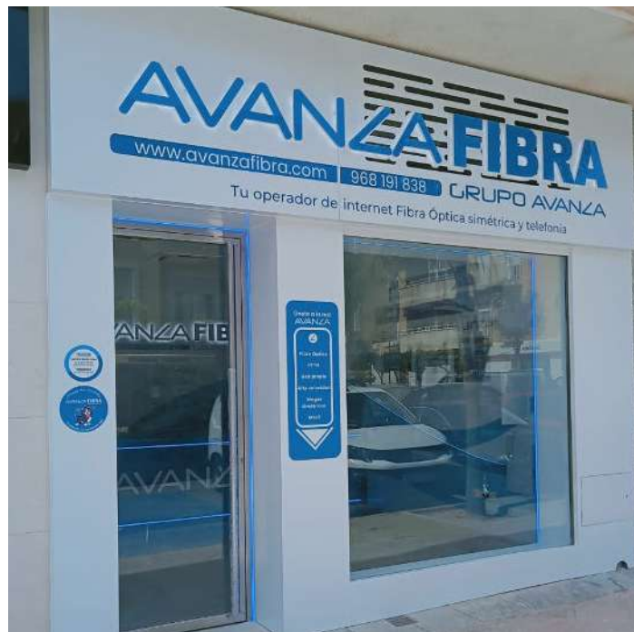
Exterior de la tienda en Vera.

los que ya contamos en dicha localidad, que contarán con profesionales del mundo de las telecomunicaciones que les ayuden y orienten a la hora