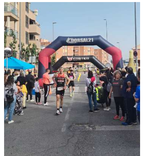
Foto en la meta de la prueba.