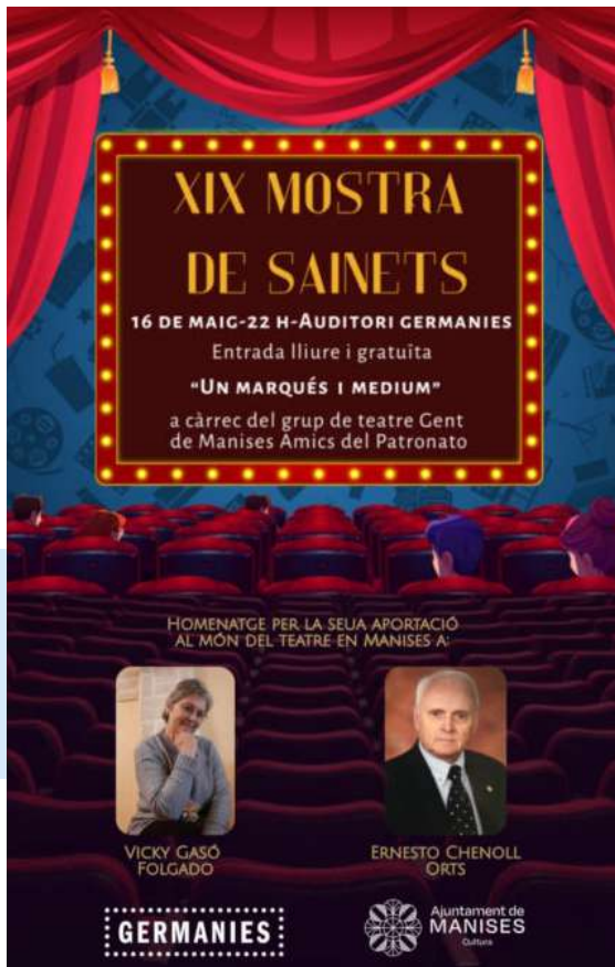
Cartel del evento.