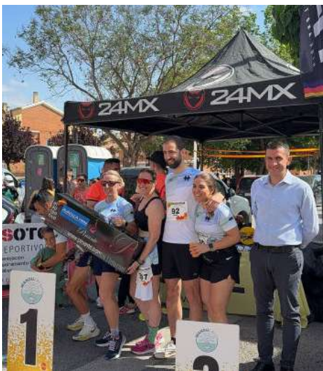
Grupo ganador del Jamón.

se ha consagrado como cita deportiva imprescindible durante la primavera. Un jamón Avanza es el premio estrella entre todos los participantes, en señal del apoyo incondicional al deporte local que siempre ofrece la compañía.