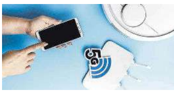
El internet de las cosas conecta elementos físicos cotidianos a otros dispositivos a través de la nube.

Internet de las cosas (IaC o IoT, «sus siglas en inglés»), un proceso que permite conectar elementos físicos cotidianos a la red al tiempo que estos dispositivos se comunican y a su vez e intercambian información entre sí, está cambiando el ritmo de nuestra vida, pero también en sectores como la sanidad, la industria y el transporte, entre otros. Su convergencia con la inteligencia artificial (IA) les permite aprender, adaptarse y tomar decisiones de forma autónoma, lo que abre un abanico de oportunidades, también importantes en el ámbito de la salud (seguimiento remoto de pacientes y alertas tempranas), la industria (mantenimiento predictivo de maquinaria), el transporte (optimización de rutas urbanas) o la agricultura (gestión eficiente del riego y cultivos). Esta convergencia permitirá un di-