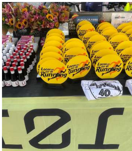
Premios repartidos a los competidores.