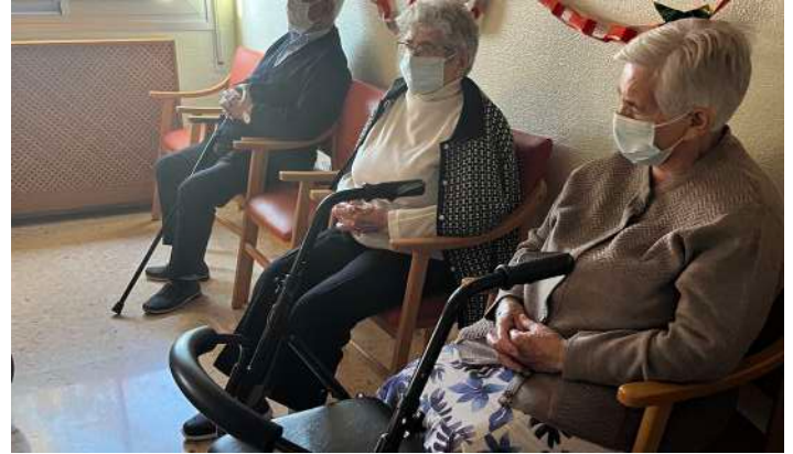
Abuelos de distintas residencias recibiendo sus cartas.

tas a los abuelos de algunas residencias de ancianos de la Región de Murcia. Además de eso la dirección de Avanza Fibra donó algunos alimentos a estas residencias. Queríamos darles una alegría, ¡pero nos la dieron ellos a nosotros! Si quieres ver estos emotivos momentos clica aquí para ver el vídeo que preparamos.