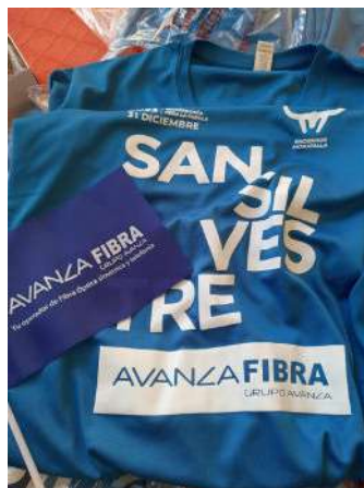
Camiseta San Silvestre Moratalla.