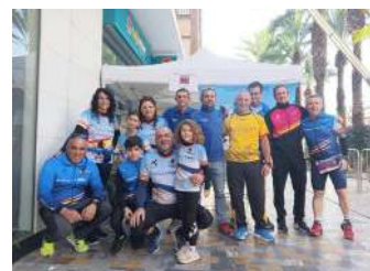
Equipo Los Tractores en las pruebas de San Silvestre.