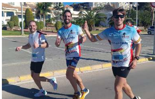
Media Maratón Internacional de Santa Pola.

Nuestro equipo de senderismo y ultratrail "Los Tractores" ha comenzado el año tal y como acabó el anterior, participando en algunas de las pruebas más conocidas del panorama nacional.