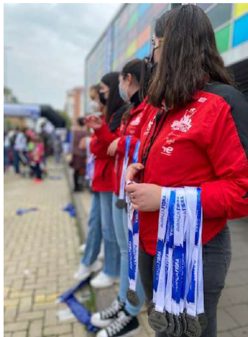
Medallas entregadas en la Minimaratón 2022.