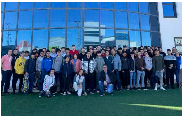
Alumnos del IES Dos Mares en la Central de Avanza Fibra.

Centro Privado de Educación Secundaria San Juan Bosco Salesianos (Cartagena). En cuanto a las visitas realizadas a los centros educativos, fuimos hasta el IES Aljada (Puente Tocinos) donde nos recibieron desde la clase de Grado Medio de Instalaciones de Telecomunicaciones y en Valencia, el CIPFP Ciudad del Aprendiz impartimos la jornada con los estudiantes de Grado Medio de Instalaciones eléctricas y automáticas.