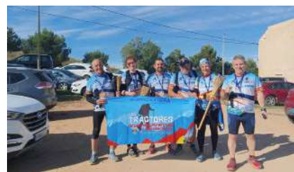
Equipo escoba de las diferentes modalidades en el Trail Vista Alegre de Cartagena.

Nuestro equipo de senderismo y ultratrail "Los Tractores" ha comenzado el año tal y como acabó el anterior, participando en algunas de las pruebas más conocidas del panorama nacional.