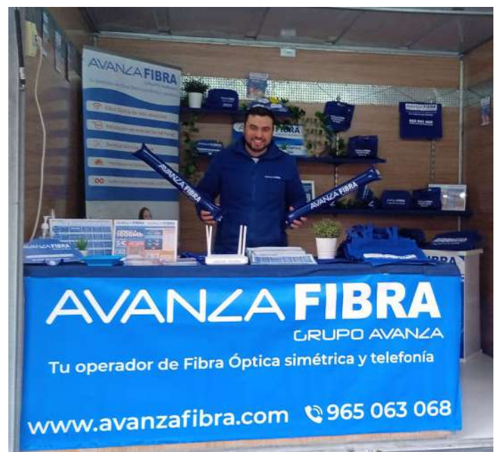
Nuestros compañeros en el stand de Avanza Fibra.