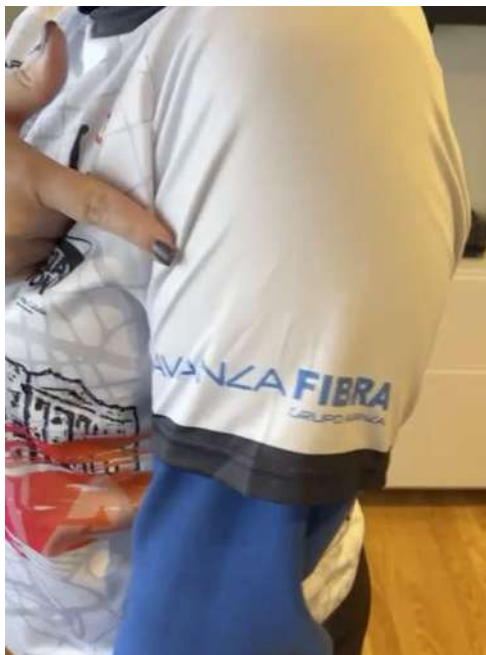
Nuestro logo en las camisetas oficiales de la prueba.

corredores” que recibirán camisetas y medallas patrocinadas por Avanza Fibra. El día 5 de febrero tendrán lugar las tres pruebas principales (10k, media maratón y maratón) con llegada en la Catedral de Murcia. Reafirmamos así nuestro compromiso con el deporte desde la infancia y la promoción de hábitos saludables con el patrocinio del evento más importante de la capital murciana.