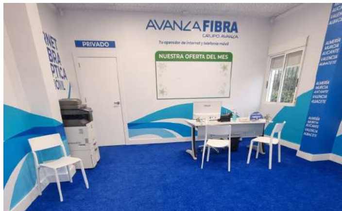
Interior del local de Els Poblets.