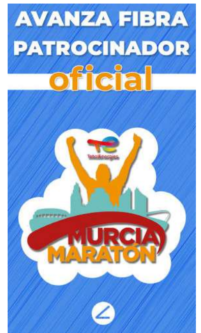
Creatividad para RR.SS.