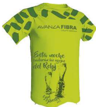
Camiseta San Silvestre Cieza