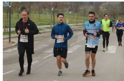
10k Sanchinarro en Madrid.