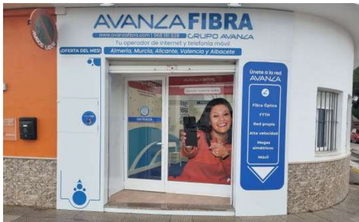
Exterior de la tienda.

En los próximos días abrirá sus puertas nuestra segunda tienda en la ciudad de Lorca, como muestra del continuo crecimiento de Avanza Fibra y todo su despliegue por las provincias donde tenemos tiendas (Murcia, Alicante, Valencia, Almería y Albacete).