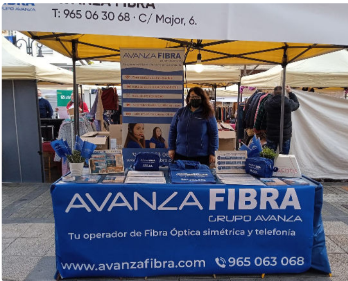
Belén, en la Fira de Nadal de Aldaia (Valencia)