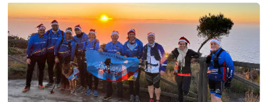
Entrenamiento Batería de Cenizas en Cartagena