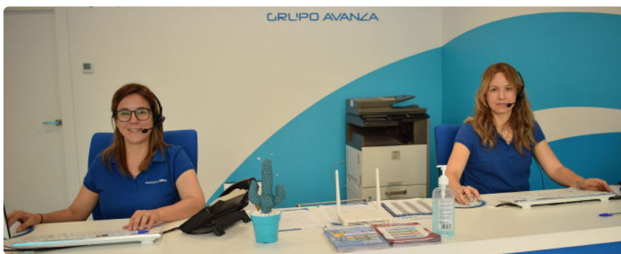
Fotografías de diferentes tiendas de Avanza Fibra en Alcorcón (Madrid), Villena (Alicante), C.C. Almenara (Lorca), Paiporta (Valencia) y Cuevas del Almanzora (Almería).