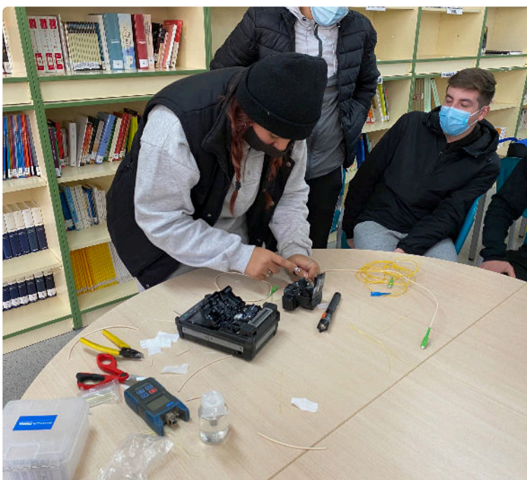
Alumna de FP fusionando “in situ” tras la charla de formación

A este programa gratuito, pilar de nuestra RSC (Responsabilidad Social Corporativa), puede inscribirse cualquier centro que esté dentro del área de influencia de Avanza Fibra.