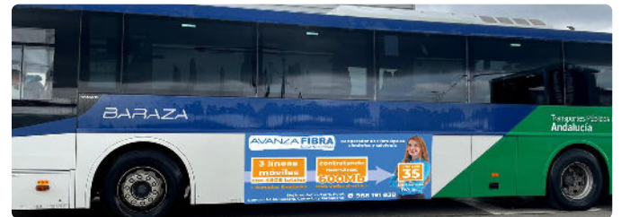
Autobús de Mojácar con publicidad de Avanza Fibra