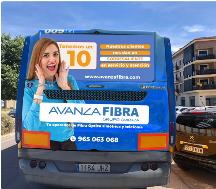
Trasera de un autobús de Valencia con la imagen de Avanza

Palmar (Murcia), es la imagen de la nueva creatividad que ha diseñado el Departamento de Comunicación y Marketing para la publicidad en autobuses de Almería y Valencia y vallas publicitarias. El sobresaliente con el que nos califican nuestros clientes es el lema de esta nueva campaña.