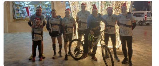
Deporte pre-Nochebuena Pilar de la Horadada