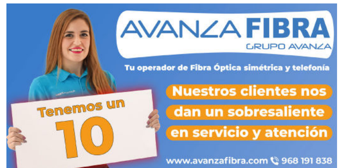
Imagen publicitaria de Avanza Fibra