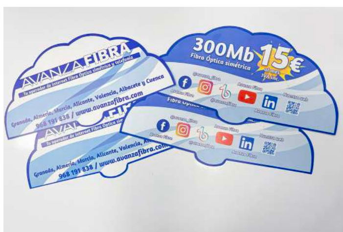
Abanicos que se entregarán durante el festival.