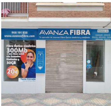
Fachada de la tienda de Águilas.

esta razón que, en las próximas semanas, saldrán convocatorias para diferentes puestos de trabajo, los que se han de cubrir por nuevas aperturas y los que se necesitan para ampliación de los servicios ya existentes (si estás interesado envía CV a empleo@avanzafibra.com donde valoraremos tus conocimientos y posibilidades de poder incorporarte a la familia AVANZA).