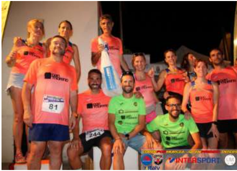
Rincón de Seca.

general, desde el stand instalado para ello. Las últimas citas de esta liga han sido Guadalupe y Rincón de Seca, pedanías murcianas donde no solo se contó con nuestra presencia sino que también se contó con la presencia del equipo de ultrafondo "Los Tractores", al que patrocinamos.