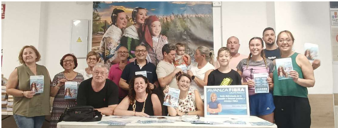
Falla Plaça D'Espanya.

campaña que ya luce en su local. La campaña "Wifi para todos" es una iniciativa de Avanza Fibra cuyo objetivo es conectar asociaciones, colectivos y corporaciones municipales, instalando de manera gratuita el acceso a internet. Si quieres formar parte de este proyecto, llámanos al tlf 968 19 18 38