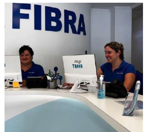
Comerciales en la tienda de San Javier.