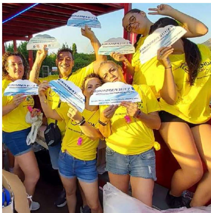
Los habitantes de Santo Ángel recibieron multitud de abanicos de Avanza Fibra en las carrozas de la localidad.