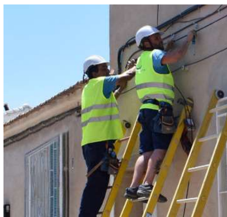
Técnicos realizando una instalación.