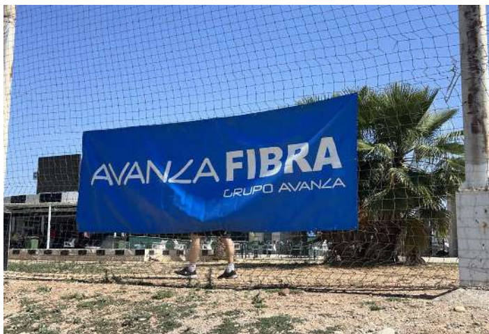
Lona publicitaria de Avanza Fibra.

distintos partidos además de sortear balones de reglamento entre los equipos participantes. Una muestra más del apoyo al deporte base, una etapa esencial para que los más jóvenes no pierdan el contacto con el deporte y la vida saludable.