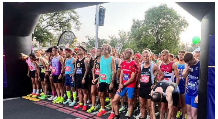
Salida de la prueba.