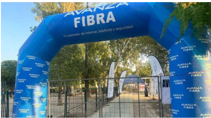
Arco de meta Avanza Fibra en la zona postcarrera.

vos. Una gran acogida la de esta prueba, que nos permitió tener una presencia directa y cercana con los deportistas. Además, nuestro arco hinchable corporativo tuvo un lugar destacado en la zona post-meta, instalada frente a la emblemática Plaza de la Cruz Roja. Este punto no solo sirvió como referencia visual para los asistentes, sino que también se convirtió en un espacio de encuentro y celebración tras la carrera.