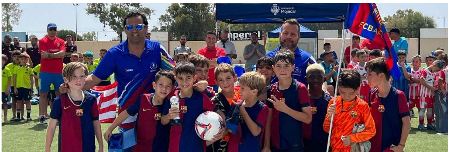
Equipo participante en el torneo.