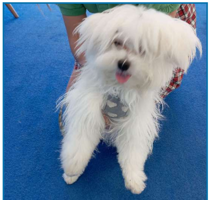
Coco (San Pedro del Pinatar).