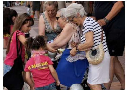
Merch de Avanza repartido durante las fiestas.