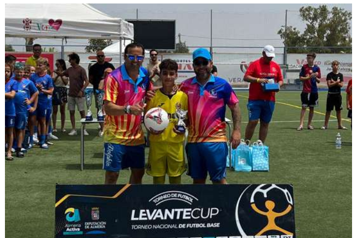
Sorteo del balón de reglamento donado por Avanza.