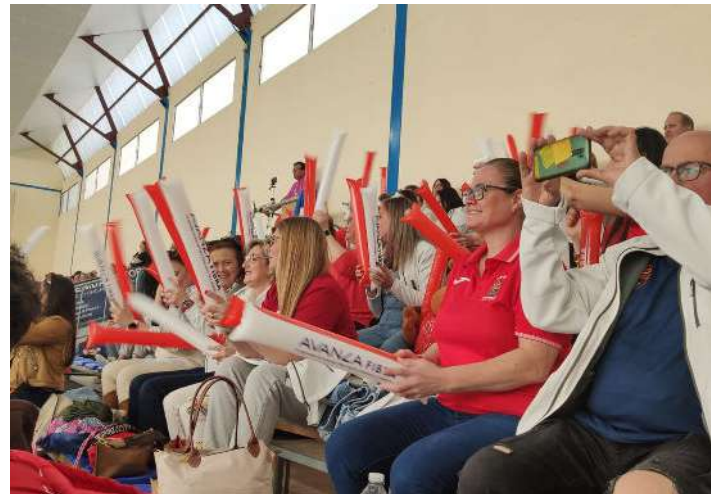
La grada animando con los aplaudidores Avanza.