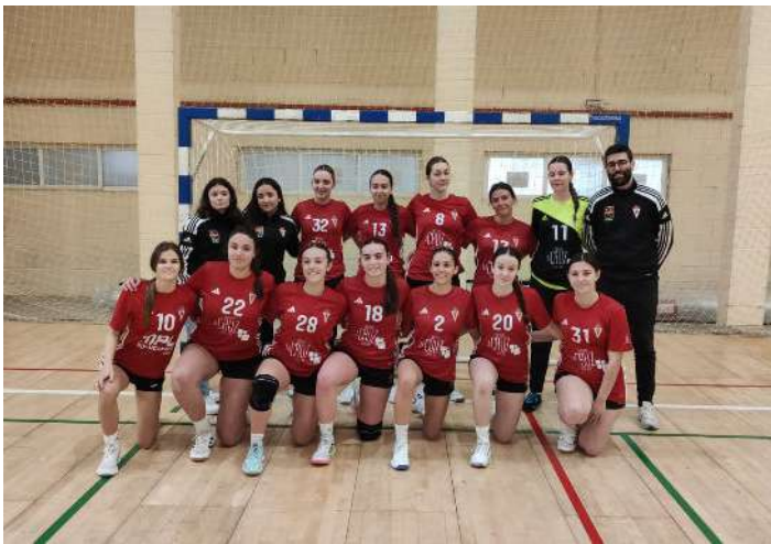
Equipo Femenino Juvenil CB Real Murcia San Lorenzo.

El Club Balonmano Real Murcia San Lorenzo de Murcia animó con aplaudidores Avanza a su equipo juvenil femenino en el partido más importante de la temporada, que las proclamó terceras en su categoría. Un gran resultado fruto del esfuerzo, compromiso y entrega de todas las jugadoras del equipo.