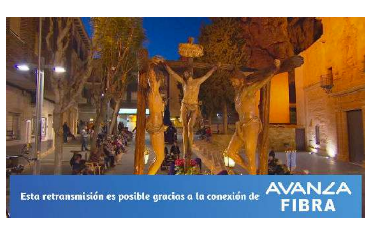
Momentos de la semana santa de Lorca (Murcia), retransmitida por "El Lorquino TV".