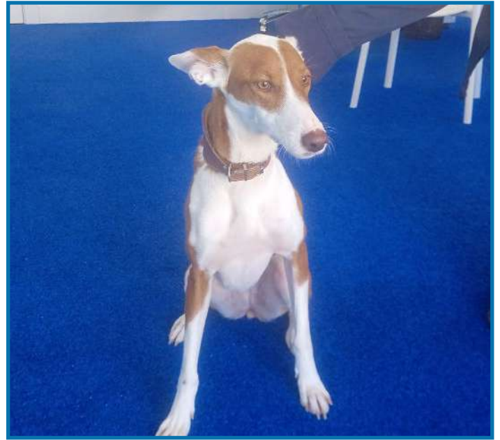
Mel (Els Poblets).