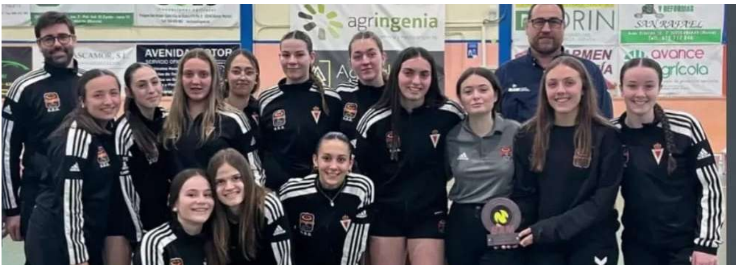
Las chicas con el premio tras el partido.