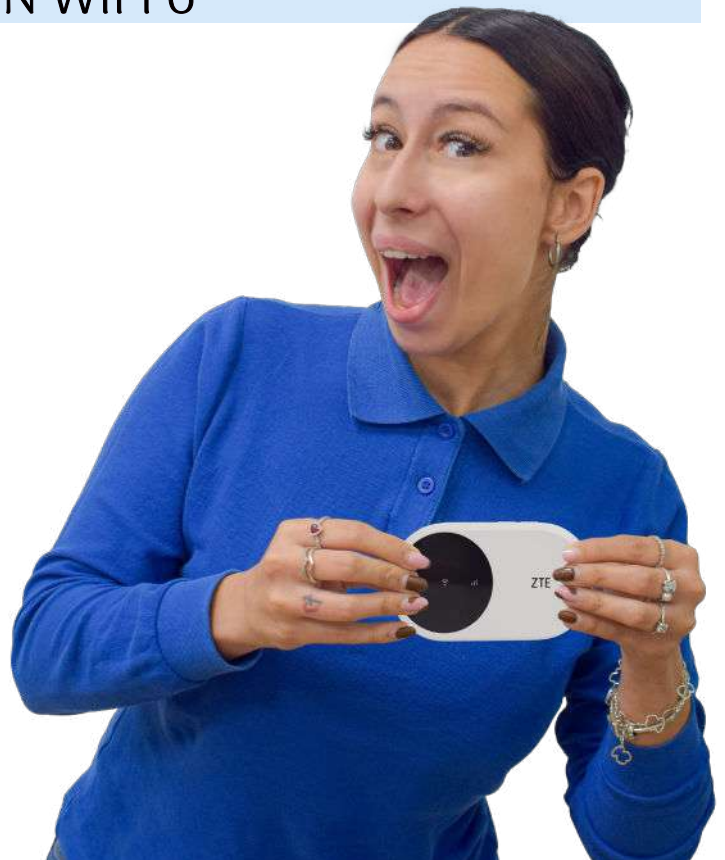
Nuevo router 4G WiFi 6.

Ya tienes disponible en las tiendas de Avanza Fibra el nuevo router inalámbrico 4G con Wifi 6 , disponible en todas nuestras tiendas. Este dispositivo ofrece conexión WiFi de última generación dondequiera que estés, utilizando una tarjeta SIM para proporcionar acceso a internet. Con capacidad para proporcionar conexión estable y rápida, destacando su versatilidad para adaptarse a diferentes necesidades de uso. Algunas de sus características son: -Procesador Qualcomm Snapdragon 9207 , -Velocidad FDD: DL/UL 150Mbps/50Mbps, -Velocidad TDD: DL/UL 110Mbps/11Mbps, -Batería: 2000mAh. Ya no tendrás que preocuparte por estar sin conexión en tus desplazamientos o en áreas donde la conexión fija es limitada. El router 4G Wifi 6 de Avanza Fibra te ofrece la libertad de navegar, trabajar, jugar y disfrutar de internet con la misma calidad y velocidad que puedes tener en casa por solo 35€. Visita cualquiera de nuestras tiendas para descubrir más sobre este producto y cómo puede mejorar tu día a día con la mejor conexión.